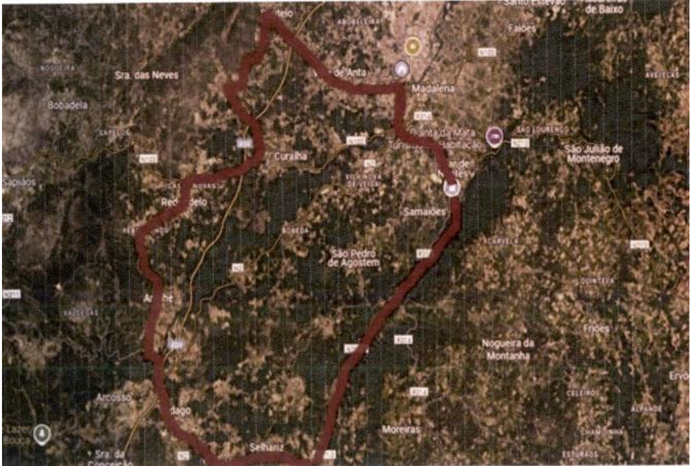
Figura 1 - Percurso do 3.º Passeio de Cinquentinhas – Vilar de Nantes.

1.3 - O requerente solicita autorização para utilização das vias públicas para fins diferentes da normal circulação de peões e veículos, pelas seguintes localidades pertencentes ao concelho de Chaves e conforme os detalhes e imagem do Google Maps que se seguem: